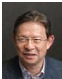
联合国环境规划署金融行动机构 特别顾问 末吉 竹二郎氏 (1945年1月3日生)

不可否认,山田电机的经营环境无时无刻都在发生变化。从消费者的生活方式到电力市场的自由化等能源改革,都在不断变化。在如此多变的经营环境中,业界先驱的山田电机在社长的带领下,大家共同努力,逐步恢复了业绩。我真切地希望山田电机在发展主业的同时,创造能与社会共享的新价值,能与社会共同持续发展。