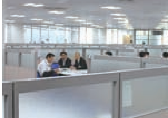
▲与合作商洽谈的情景

与商务伙伴保持健全和透明的关系,构建双方都有利的长期信赖关系等,根据公正运营实践原则实现互惠互利、共存共荣。