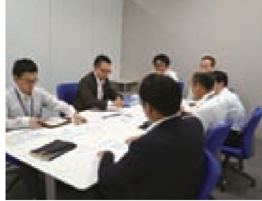
▲商品部合规学习会

山田电机作为企业市民,为了赢得社会的信赖,以事业的可持续发展为目标,保证企业活动的公正性和透明性。建立能迅速作出经营决断的经营结构,保持企业价值和股东价值的可持续提高。